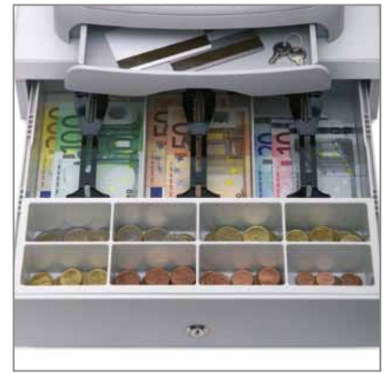
KOMPAKTE KASSENSCHUBLADE mit zusätzlichem Ablagefach