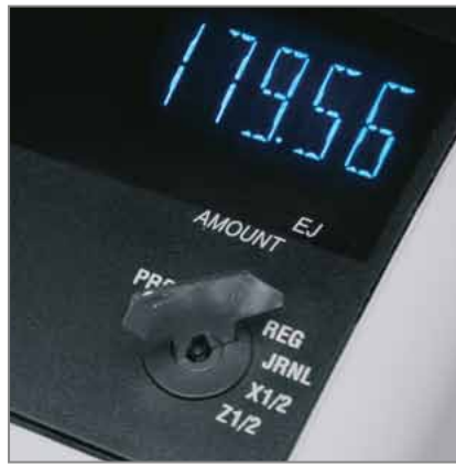
FUNKTIONSSCHLOSS für sichere und einfache Wahl der Betriebsart